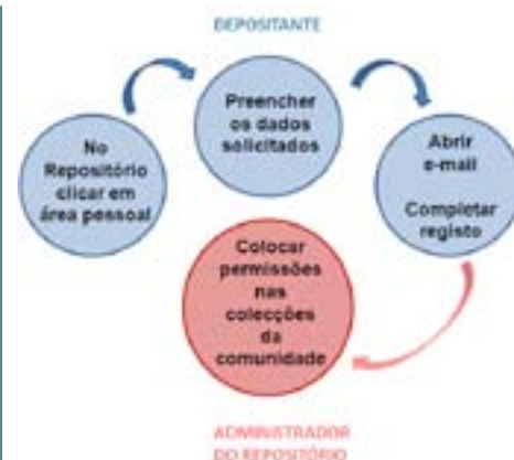
Figura 2 – Fases do registo de depositantes no RCIPCB.

O conjunto de depositantes registados até ao momento é insuficiente para garantir um crescimento constante do RCIPCB. O esforço acrescido realizado pelas bibliotecárias do IPCB no sentido de angariarem documentos para depósito tem dado os seus frutos em termos de quantidade de documentos. No entanto, sendo objectivo do RCIPCB crescer pela via do auto-arquivo, este não é a forma desejável.