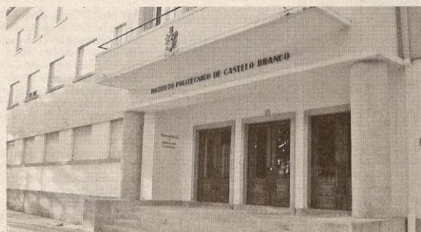
O IPCB apresenta novos cursos, um deles pós-laboral