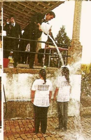
O “baptismo do Caloiro”