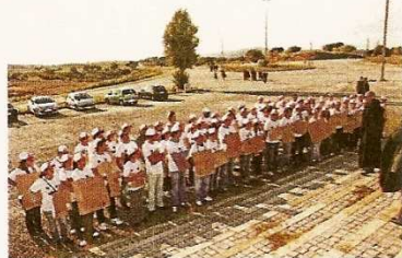
Chegamos ao Terreiro da Senhora