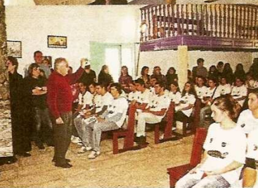
Um “momento de paz e interioridade”