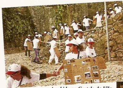
A subida ao Castelo da Vila