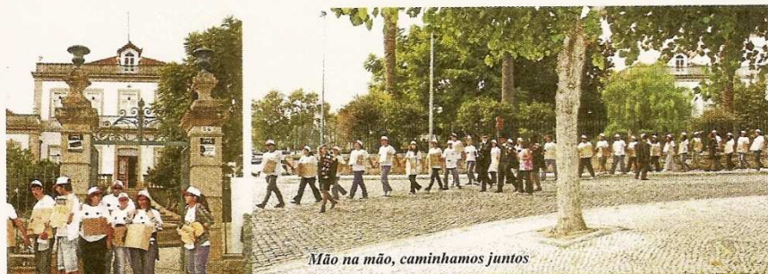
Mão na mão, caminhamos juntos

Foi na tarde do passado dia 14 de Outubro que a Comissão das Praxes da Escola Superior de Gestão de Idanha-a-Nova conduziu os novos alunos – os “Caloiros” – em romagem, a pé, desde as portas da sua Escola até ao Santuário de Nossa Senhora do Almortão, num percurso de sete quilómetros. Trata-se de uma tradição académica, iniciada pelos primeiros alunos desta Escola, como meio de inserir os novos alunos no ambiente social, característico das gentes da Vila de Idanha-a-Nova. De facto, em boa hora surgiu a iniciativa que se tem revelado de uma receptividade preciosa por parte das muitas gerações de jovens que, ao mesmo tempo que procuram a sua formação académica na ESGIN, descobrem um ambiente amigável e rico de tradição, por parte da população da Vila. Por testemunhos abundantes dos próprios jovens, a Senhora do Almortão vai fazendo parte da sua vivência humana e espiritual, nos momentos de solidão, saudades da família e igualmente nas alegrias e êxitos de suas vidas.