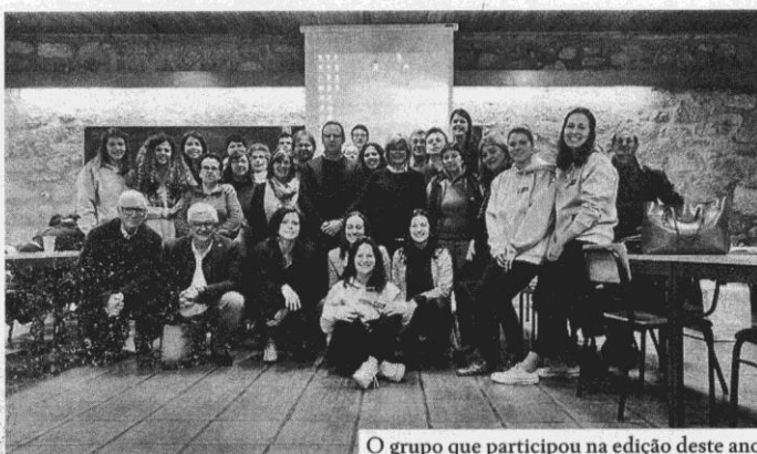
O grupo que participou na edição deste ano

A incubadora I-Danha é um projeto coordenado pelo Centro Municipal de Cultura e Desenvolvimento (CMCD) que tem como investidor social a referida autarquia e pretende ser um acelerador e potenciador de consciências sociais, tal como também é explicado na informação enviada à imprensa no início desta semana.