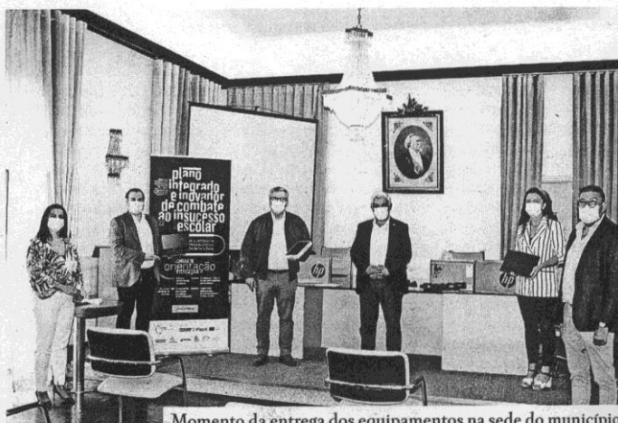
Momento da entrega dos equipamentos na sede do município

"A ação tem como destinatários primários os alunos identificados pelo Agrupamento de Escolas José Silvestre Ribeiro, mas quisemos contemplar também os alunos da Escola Profissional da Raia (EPRIN) e da Escola Superior de Gestão de