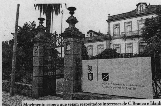
Movimento espera que sejam respeitados interesses de C. Branco e Idanha

Recordam o pedido de “revisão detalhada” que consta nos pareceres da Secretaria Geral de Educação e Ciência (SGEC) e da Direção Geral do Ensino Superior (DGES) e a recomendação que estas instâncias deixam ao presidente do IPCB, para que tenha em conta “os termos adequados à missão do IPCB no quadro do papel dos politécnicos no desenvolvimento dos territórios e na coesão territorial”, em ar-