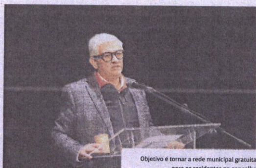
Objetivo é tornar a rede municipal gratuita para os residentes no concelho

Trata-se de 1,2 milhões de euros para os próximos cinco anos