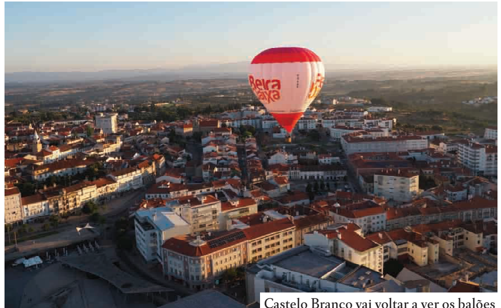
Castelo Branco vai voltar a ver os balões

O "Voar na Beira Baixa" é uma organização da Comunidade Intermunicipal da Beira Baixa, com direção técnica da Windpassenger, uma empresa portuguesa especializada em voos de balão de ar quente. Segundo esta pelo céu da região vão voar o maior balão de forma especial do mundo, um barco voador de piratas e o balão da Beira Baixa, entre outros. Em terra realiza-se uma caminhada urbana com oito quilómetros na